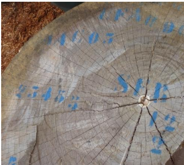
Figure 2 : Bois avec marques de SFB, AAC 3 UFA 09 009