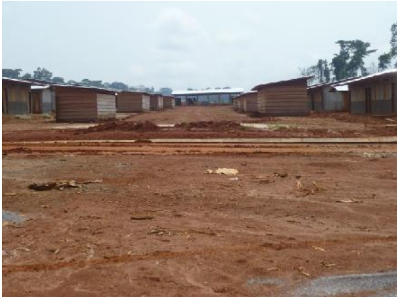
Figure 3 : Maisons des ouvriers de SUDCAM (partie Nord)